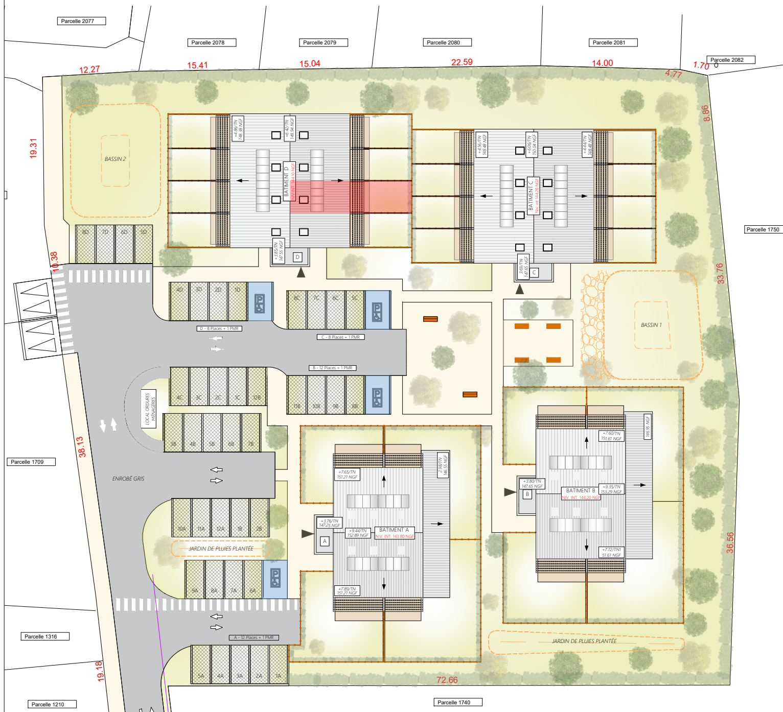
PLAN DE MASSE - Ech. 1/500